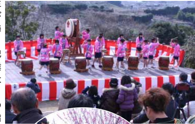
上中2年生による梅林太鼓演奏

今年の咲き始めは昨年より10日ほど早く、1月25日(日)の南部梅林開園日にさっそく訪れたお客様が梅花の香りを楽しんでいました。南部梅林、岩代大梅林とも、今年も週末や祝日などに様々なイベントを行い観梅のお客様をもてなしました。2月7日(土)には、南部梅林で恒例の上南部中2年生による梅林太鼓演奏が行われましたが、その折、2年生と3年生の代表、それぞれ3人が南部梅林・梅公園内へ梅の苗木を植樹しました。2年生は梅林太鼓演奏記念として、3年生は卒業記念としてで、品種名は「道知辺(みちしるべ)」。今後、生徒たちに人生の目標(みちしるべ)を目指して生きてほしいという願いもこめられているそうです。