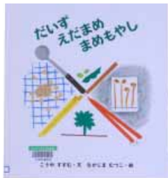
こやすすむ (福音館書店)

愛は負けない 福原愛選手ストーリー(生島淳) 学校のオバケたいじ大作戦(富安陽子) ペロー昔話・寓話集(パロ) ルワンダの祈り(後藤健二) 海がやってきた(テボアソ) 真夜中のまほう(アケ) 虫のこどもたち(新開孝) だるまさんが(かがくいひろし) カワセミ(嶋田忠)