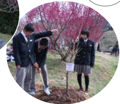
3年生は、卒業記念植樹