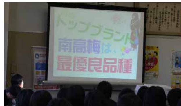
私たちが作った南高梅のPRビデオをご覧ください

1月16日(金)、高城中学校で3年生による総合発表会があり、保護者も大勢来場しました。3年生たちが発表した学習のまとめは次の通りです。いずれも聴き応えのある発表ばかりでした。みなべ町の活性化、和歌山県のプロ野球球団、南高梅とそのPR、みなべ町の漁業、漁業と温暖化、みなべ町の農業