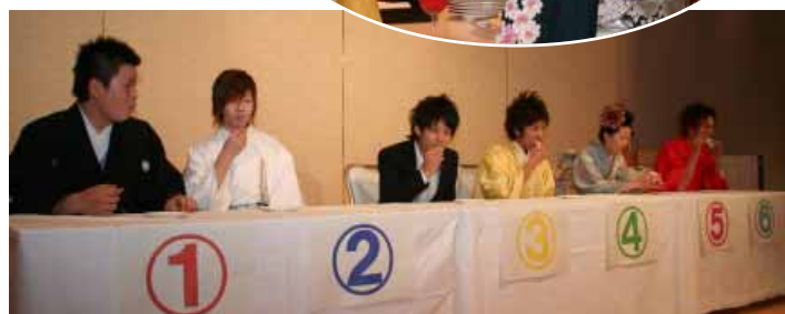
「だれがカラシ入りのサンドウィッチを食べたかな？」