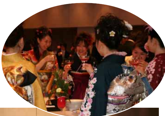
新成人を祝って「かほくい！」(飲み物はノンアルコールのシャンパン)