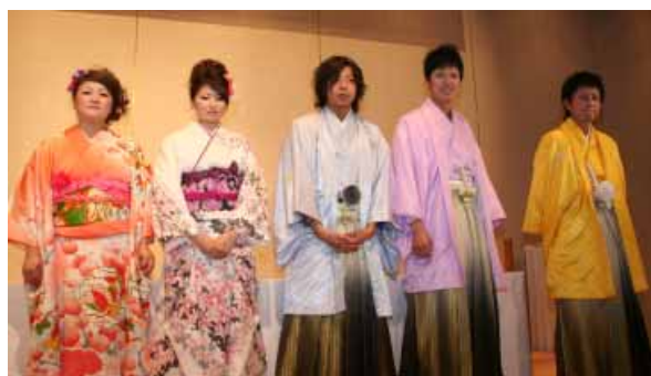
「みんな今日は楽しかったですか?」。集いを見事に企画運営してくれた成人式実行委員会の皆さんです