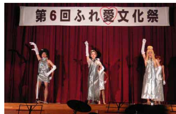
会場が一番沸いた、生徒たちの熱演です

昨年12月14日(日)、清川中学校でふれ愛文化祭が行われ、地域の皆さんも大勢来場しました。生徒たちの熱演に加え、清川保育園児の演技、炭琴クラブの皆さんの演奏やお母さん方の合唱などもあり、会場は大いに沸きました。