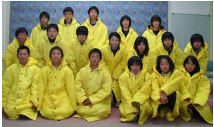
ジュニア駅伝大会選手に選抜された皆さん

2月15日(日)、第8回市町村対抗ジュニア駅伝競走大会が和歌山市で開催されます。それに向けて、ただ今、町内から選抜された小中学生がボランティアのコーチ陣の指導のもと一生懸命練習しています。どうぞ応援をお願いします。