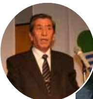
「立派な社会人になってください」と祝辞を述べる小谷町長