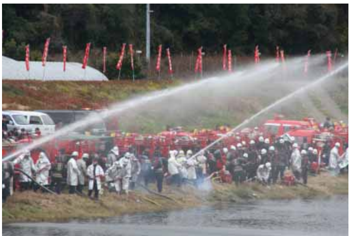
須賀橋付近河川敷で行われた放水訓練