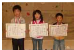
小学生低学年の部