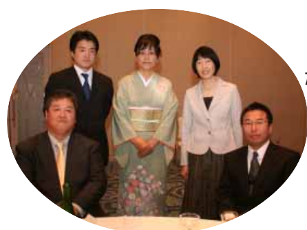
「みんながんばって、中学校時代の恩師5人もお祝いに来てくれました」