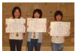
小学生高学年の部