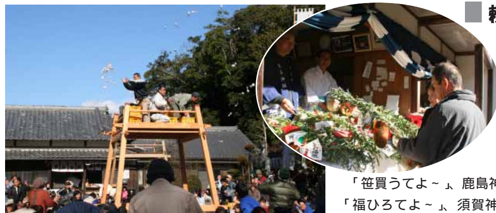
「笹買うてよ〜」、鹿島神社で「福ひろてよ〜」、須賀神社で

今年は本えびすの10日(土)に雪が降るなど天候に恵まれませんでした。それでも景気回復を願う大勢の人でにぎわいました。