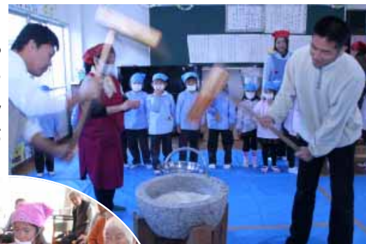
南部幼稚園で「お父さん、おばあちゃん、がんばって」

昨年12月、町内の各保育所や幼稚園などで年末恒例のおもちつきが行われ、園児たちがお父さんやお母さん、おばあちゃんやおじいちゃんと一緒にぺったん、ぺったんと楽しみました。また、12月14日(日)には、青少年育成町民会議主催のおもちつき大会があり、大勢の子どもたちが参加しました。