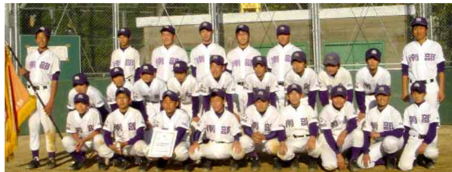
南部中学校野球部

会・日高大会を勝ち抜いた南部中学校野球部が、昨年11月22日(土)、岩出市で行われた決勝戦に出場し、那賀代表の粉河中学校を破って優勝しました。