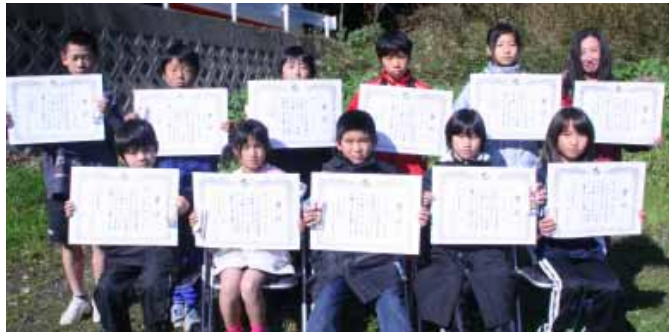
表彰式に出席した各部門1位の皆さん

町マラソン大会で233人が応援受け快走! 第4回町内マラソン大会が12月7日(日)、須賀神社(西本庄)を発着点に行われました。今回は小学生から大人まで233人が出場し、大勢の人たちの応援を受けながら、健脚を競い合いました。