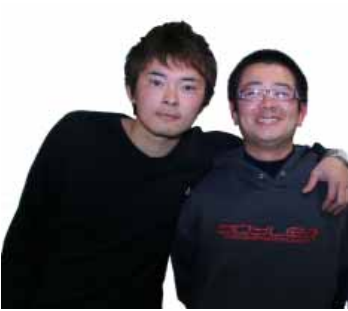
有本さん 活動にかかわって大勢