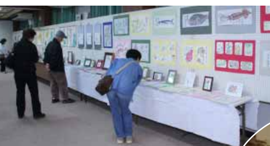
11月2日(日)~3日(月)、生涯学習センター( )と南部公民館( )で開催された大展示会で