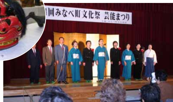
11月16日(日)、ふれ愛センターで開催された芸能まつりで