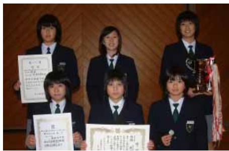
南部中バレーボール部

南部中学校の3スポーツクラブが11月に行われた県大会で優秀な成績を納めました。バレーボール部 11月8日(土)、9日(日)、橋本市で行われた県中学校バレーボール新人大会で、バレーボール部が優勝しました。同部は来年3月に開催される近畿大会に出場します。同部のメンバーは次の生徒たちです。