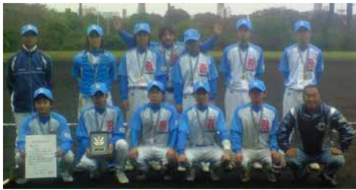
一ノ宮クラブの皆さん