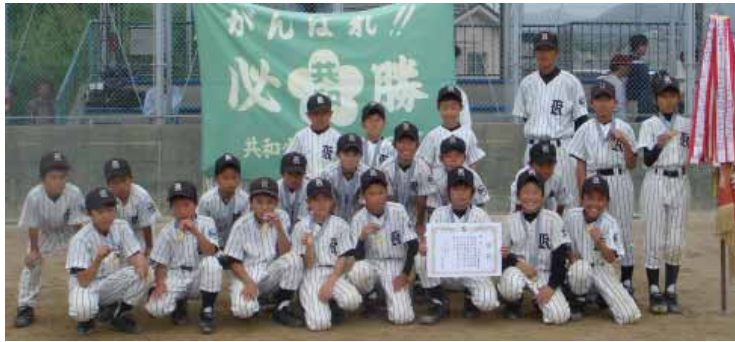
共和チームの子どもたち

5月17日(土)、24日(土)、第4回町少年野球連盟杯大会が共和球場で行われました。