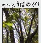
町の木 うばめがし