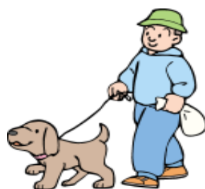
犬と外出する時はフンを持ち帰る袋をお忘れなく

犬を飼っている皆さん、我が家の犬は子どもものようにかわいいことと思います。だからこそ、きちんとした「しつけ」も必要になります。そして、飼い主自身もマナーと義務を守り、人間と犬とが仲良く共生していきたいものです。