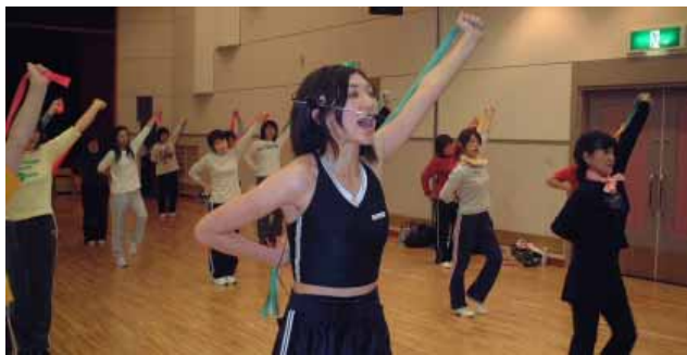
「はい、腕を思い切り上げて～」