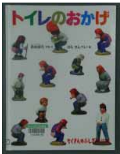
森枝雄司 写真・文 (福音館書店)

高校生のためのメディア・リテラシー(林直哉) ゴキブリが愛される時? (木船紘爾) きょうりゅう大すき! (A・マカスター) ムンジャクンジュは毛虫じゃない(岡田淳) オチケン(大倉崇裕) 品格あるお金の作法(伊藤宏一) 乱太郎の忍者の世界(尼子騒兵衛) マンガものがたり韓国史1～3(徐永) だいききなもの(公文健太郎)