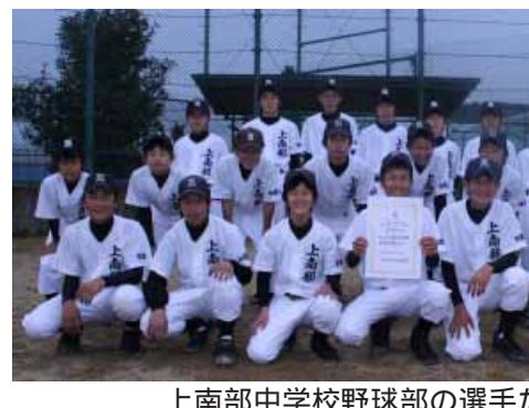
上南部中学校野球部の選手たち

11月18日(日)、ミカサカップ第28回県小学生バレーボール男女選手権大会が白浜町で開催され、女子の部で南部バレーボールスポーツ少年団が優勝、高城ジュニアバレーボールクラブがベスト4に入賞しました。優勝した南部は12月23日(日)に京都府で開催された近畿大会へ出場しました。南部のメンバーは次の子ど