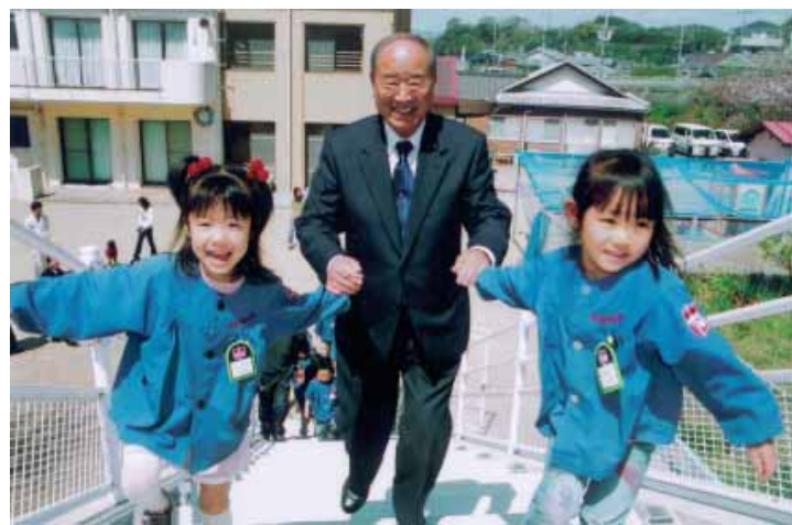
子どもたちとしっかり手をつないで (昨年4月6日、愛之園保育園内の避難路竣工式で)

わが町の主幹産業である梅「UME」についても冬の時代が続いています。昨年来の荷動きからみて幾分明るさが見えてきたような気がします。これも国内の他産地、また中国などの国外産との激しい競争に打ち勝たなければ生き残る道は開けません。関係者、すなわち生産者・JA・加工販売業界・行政の