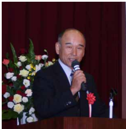
「共に学んで、しっかりとまちづくりを」(昨年11月10日、みなべ学びの日制定記念式典で)

にとつては、4年に一度、選挙という形で直接町政に参画できる意義深い年でもありません。この機会にこれからのみなべ町のあり方をよく考えていただき、希望の開ける、より良き町へ前進するよう念願いたします。皆様のご健康をお祈り申し上げます。