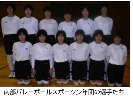
南部バレーボールスポーツ少年団の選手たち

11月18日(日)、ミカサカップ第28回県小学生バレーボール男女選手権大会が白浜町で開催され、女子の部で南部バレーボールスポーツ少年団が優勝、高城ジュニアバレーボールクラブがベスト4に入賞しました。優勝した南部は12月23日(日)に京都府で開催された近畿大会へ出場しました。南部のメンバーは次の子ど