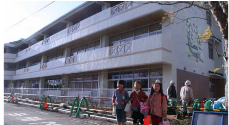
「もうすぐ新しい校舎で勉強できるよ。うれしいな」

平成18年8月から行っていた南部小学校・新校舎建築工事がこのほど完成し、1月8日(火)、竣工式が行われます。いよいよこの日から、完成を待ちわびてい