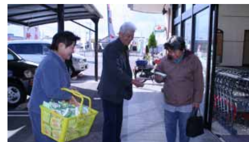
Aコープみなべ様前で