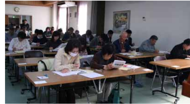
皆さん、真剣です(南部公民館の試験会場で)

昨年11月25日(日)、第1回紀州みなべ検定試験(町商工会など主催)が南部公民館(片町)とふれ愛センター(東本庄)で行われ、一般の部71人、ジュニアの部58人が受験しました。