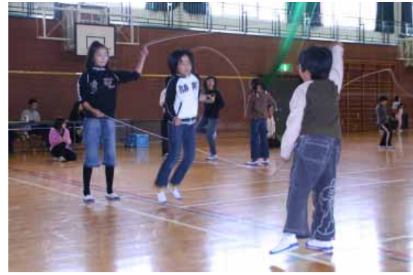
3人の息を合わせてダブルダッチ

昨年12月15日(土)、第2回みなべ町なわとび大会(青年クラブみなべ主催)が上南部小学校体育館で開催されました。個人の部とふれあいなわとびの部へ、小学生から大人まで約60人が参加して、なわとびの技を競い合いました。町内のダブルダッチサークル「梅遊繩」による模範演技も披露され、参加者はその見事なとびわざに見入っていました。