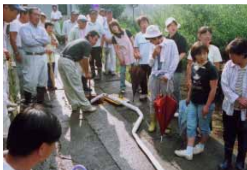
「もしかの時はここから放水してください」。熊瀬川区では、消火栓から放水訓練を行いました。