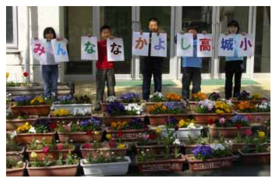
奨励賞受賞の高城小の子どもたち