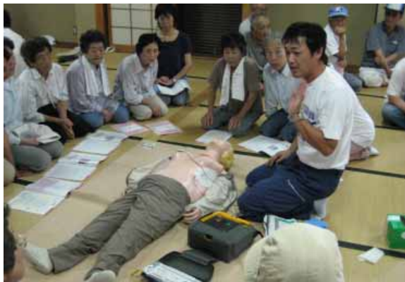
「これを使えば助かる確率がぐんと高くなります。」堺区で行われたAED(自動対外式除細動器)講習会

当日行われた訓練は、各区のそれぞれの避難場所への参集のほか、次の通りです。( )内は実施地区) 日高広域消防によるAEDと心肺蘇生法講習(堺)、初期消火訓練(消火器の使い方)(埴田)、給水訓練(片町)、初期消火訓練(パケツリレーなど)(新町)、初期消火訓練(パケツリレー)・ビデオ鑑賞(北道)、初期消火訓練(南道)、資機材の使用