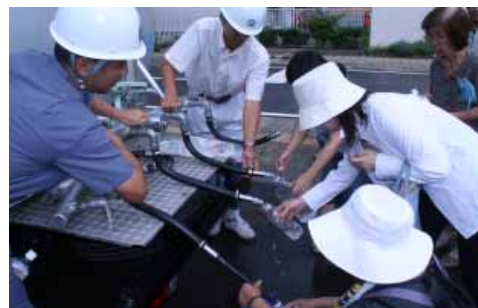
「本当の災害のときは、これでは足りんけど」と、給水車からペットボトルに水をくむ片町区の皆さん

9月2日(日)朝、町は第3回町内一斉防災訓練を実施しました。当日は、ちょうど訓練の時間を狙いすぎましたように激しく降った雨にもかかわらず、子どもからお年寄りまで4,842人、全町民の約33%が参加しました。(第1回の参加者は4,319人、第2回は5,153人)