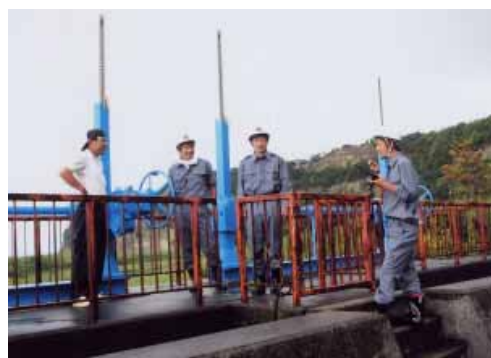
山内区では、桜川の水門の開閉訓練を行いました