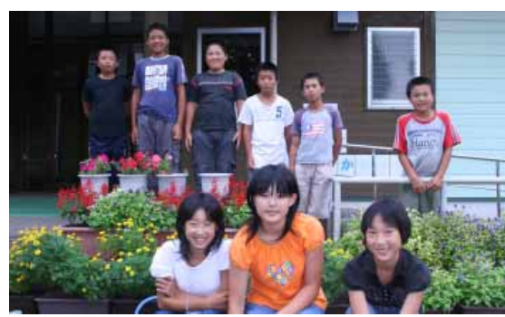
優秀賞を受賞した清川小の6年生たち

優秀賞5校、優秀賞38校、奨励賞58校) なお、清川小学校が優秀賞を受賞したのは3回目、一昨年には最優秀賞も受賞しています。