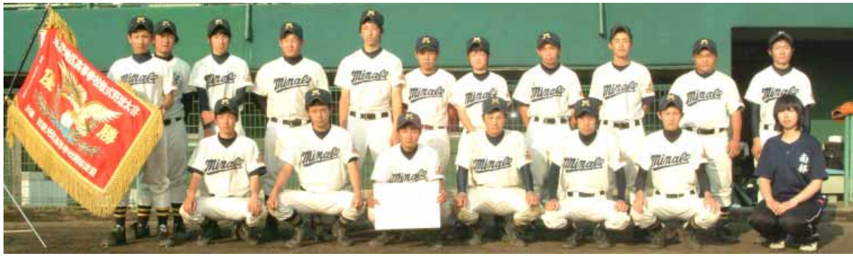
南部高校軟式野球部の皆さん