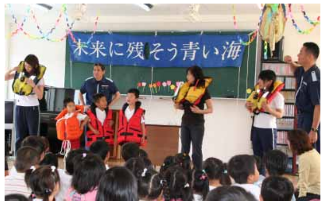
救命胴衣を着用させてもらう子どもたち

海保職員らは、ウミガメがクラゲと間違っってビニール袋を食べてしまうという紙芝居「うみがめマリンの大冒険」を読み聞かせ、海にごみを捨てないようにと呼びかけました。また、「家族が釣りにし行ったり海で遊んだりするときは、救命胴衣を着用するようにしてください」と呼びかけました。