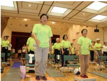
元気よく体操をする参加者たち

6月5日(火)、「我ら梅の里寝だまんず」が美浜町の健康教室参加者と合同の運動教室をふれ愛センター(東本庄)で開きました。