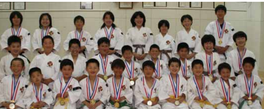
入賞した南部道院のメンバー

5月13日(日)、南部小学校体育館で行われた少林寺拳法第30回紀南熊野少年拳士大会で、南部道院の子どもたちが今年も次の通り優秀な成績を納めました。なお、総合成績も南部道院が1位でした。