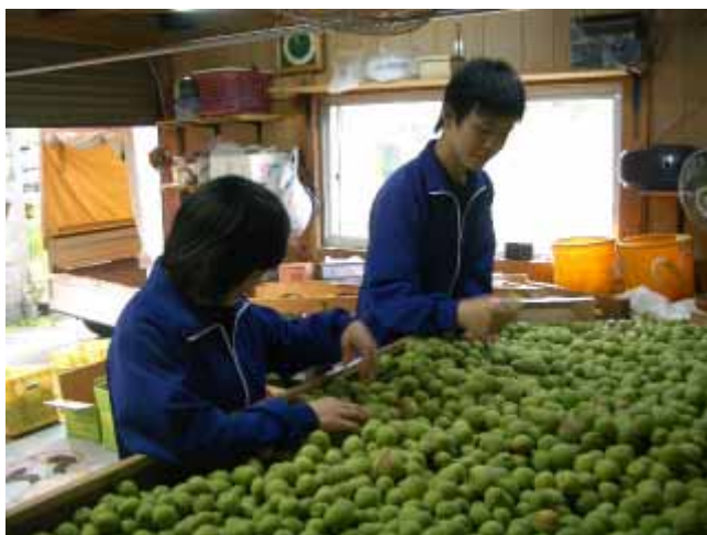
「傷はないかなあ」と目をこらして選別しています