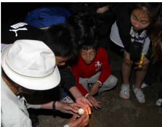
興味津々にウミガメの卵に触れる子どもたち

5月31日(木)～6月1日(金)、京都府大山崎町・第二大山崎小学校の6年生37人が、1泊2日の修学旅行でみなべ町を訪れました。