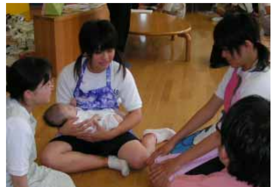
赤ちゃんを抱っこする生徒たち

生徒たちは「離乳食は味が薄くてあんまり美味しくなかった」、「赤ちゃんて、ちっちゃいけど意外と重たい」と言っていました。