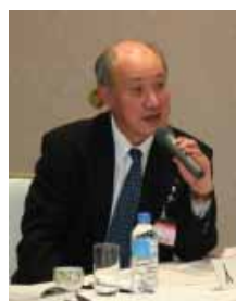
人吉市長 福永 浩介氏

「何かウメの話はないかと参加した。当市は、人吉梅園とひなまつりをセットで売り出すなど観光に力を入れており、2年後にはJRとタイアップしてS/Lも走り出す。このサミットのような、梅を前面に出した行政の取り組み方はもっと評価されていいと思う」