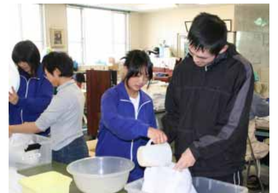
通所者と一緒に作業する生徒ら

最初に作業所の職員から、「なかよし作業所は、障がいを持った人が楽しく働ける場所です」などと施設の説明を受けました。その後、グループに分かれ、通所者と一緒に袋にラベルを貼ったり、枕を作ったりなどしました。生徒たちは「みんな優しく、やり方などを教えてくれて楽しかった」と話していました。