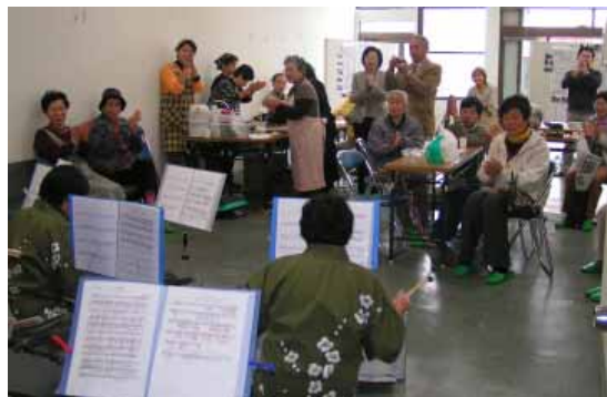
炭琴演奏会も行われ、参加者らはきれいな音色に耳を傾けていました

今回のワークショップは「みなべの食」をテーマにしたプチイベントで、参加者が持ち寄った漬け物やお茶うけ、備長炭で焼いたばかりのめざしやさつまいも、また、持ち寄った食材で作った梅なべや豚汁を、みんなでわいわいとおしゃべりしながら、おいしくいただきました。