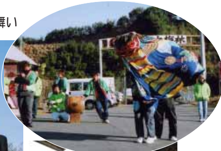
東岩代久木の獅子舞が歓迎の舞い

干館(山内)の工場見学、うめ振興館(谷口)見学、南部梅林で開催記念もちまきや梅料理の試食会などが行われました。参加した首長らはそれぞれの会場で、大勢の町民と交流を深めていました。