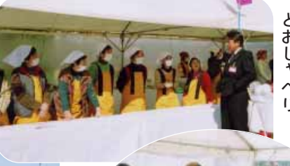
「天気で良かった、真砂充敏田辺市長とおしゃべり