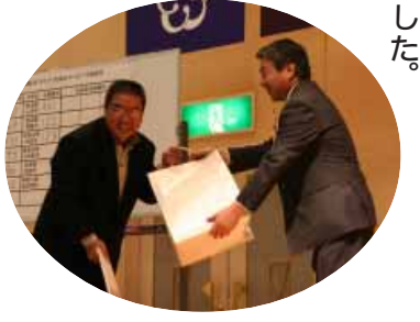
抽選会で名産品をプレゼント

な、仏法あるは幸いな、梅ありかな、そして梅は幸いかな」と、現代の世相を織り込みながら