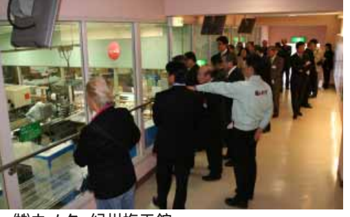
(株)ウメタ・紀州梅干館で工場見学