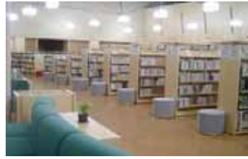
紀の川市立打田図書館

2月2日(金)、図書館協議会の皆さんと一緒に、紀の川市立打田図書館と岩出市立岩出図書館へ視察研修に出かけました。どちらも昨年4月に開館した図書館で、市内に分館や分室があり、中央館としての役割を担っています。