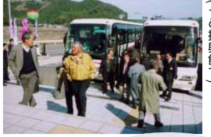
来年の梅サミット開催地である愛知県知多市の佐布里池梅林地区の皆さん50人も見学に訪れました(うめ振興館で)