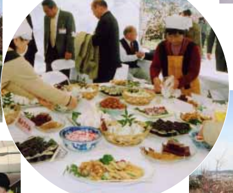
おいしそうな梅料理が並びました