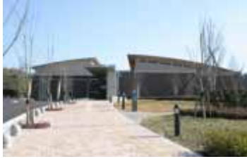
岩出市立岩出図書館

2月2日(金)、図書館協議会の皆さんと一緒に、紀の川市立打田図書館と岩出市立岩出図書館へ視察研修に出かけました。どちらも昨年4月に開館した図書館で、市内に分館や分室があり、中央館としての役割を担っています。