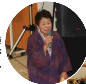
「恋はずっとせなあかんで。恋はやる気の特効薬やで」などと話す大野さん

大野さんは、昨年6月6日の梅の日のイベントで京都へ行ったことや日常生活の出来事などをユーモアを交えて話し、来場者の笑いが絶えませんでした。また、大野さんは「一番の健康法は笑うこと。脳年齢の若さの秘訣は『感動』、『興味』、『工夫』、『健康』、『恋』と強調しました。