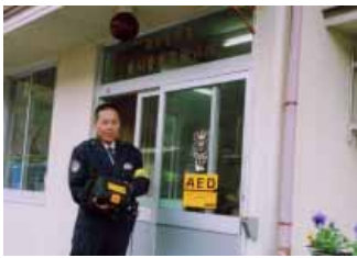
清川は清川警察官駐在所へ