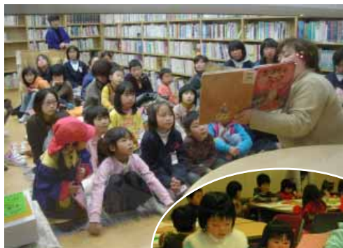
絵を描いて、切って、貼って...

12月16日(土)、ゆめよみ館の「切り絵であそぼう!」に約30人が参加。自分で図柄も考えてオリジナル作品を仕上げました。