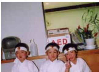
「高城は、特別養護老人ホーム・梅の里の玄関に置いてるヨ!」と高城保育所さくら組のボクたち

AED(自動対外式除細動器)とは、元気だった人が突然倒れて心肺停止状態になったとき、医療の心得のない人でも心臓に電気ショックを与えて正常な状態に戻すよう試みることができる機械です。