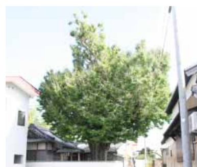
丹河地藏堂の銀杏(北道)