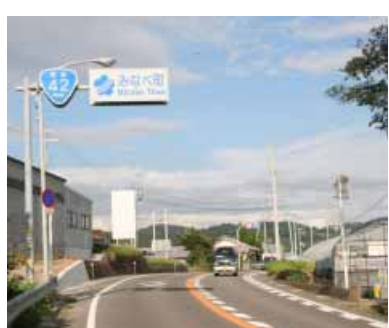
印南町～みなべ町へ(国道42号線)