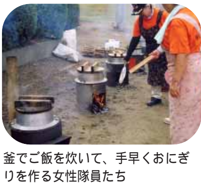
釜でご飯を炊いて、手早くおにぎりを作る女性隊員たち

総合訓練は、県北部で震度7の地震が発生、交通、通信、電気、ガス、水道などのライフラインがマヒ状態になり、多数の死傷者が発生したという想定で行われました。同隊は、テント設営やリヤ