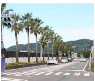
やしの木通り(国道42号線)