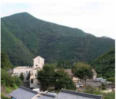
特別養護老人ホーム「梅の里」(滝)