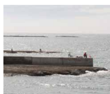
釣りを楽しむ人たち