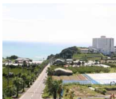
紀州南部ロイヤルホテル周辺(山内)