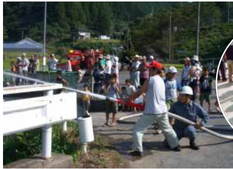
清川・名之内区の放水訓練