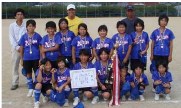
西本庄チームの子どもたち