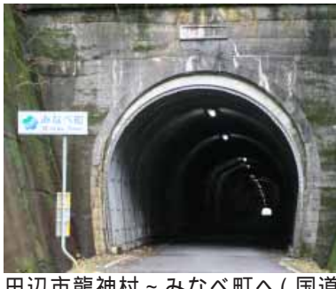
田辺市龍神村～みなべ町へ(国道424号線切目辻トンネル)