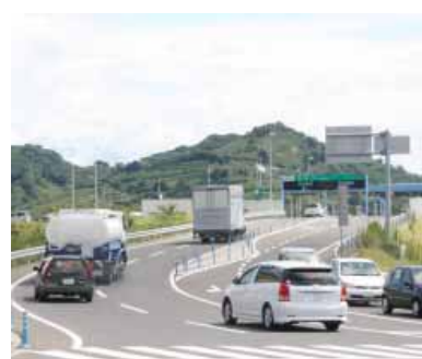
阪和自動車道みなべ IC 入口へ