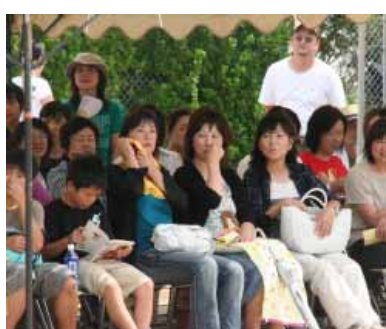
南部中学校体育祭で