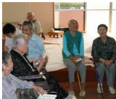
ふれ愛センターでくつろぐお年寄りたち