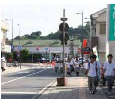
南部駅前、南高生が登校中