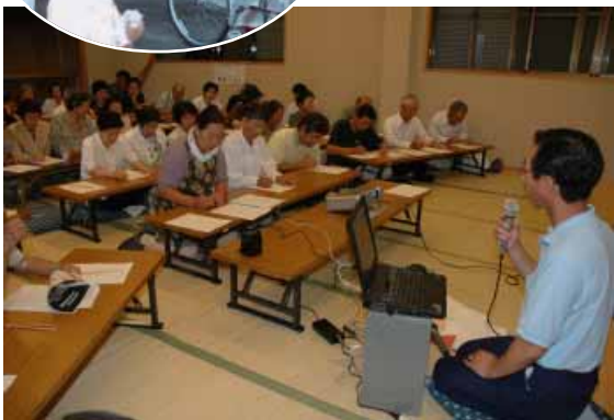
芝区、区内の防災リーダーが講師を務めた研修会「耐震診断のすすめ」