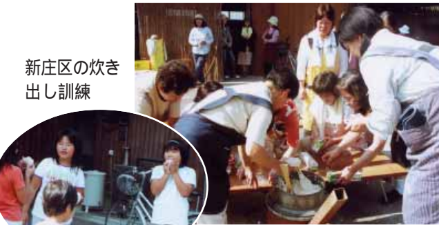
新庄区の炊き出し訓練

災研修「避難路は安全か(講師・区内で事業所を経営する建築設計士)(新町)、消火栓の位置確認・初期消火訓練(南道)、研修会「耐震診断のすすめ(講師・区内の防災リーダー)(芝)、ビデオ鑑賞と初期消火訓練(芝崎)、初期消火訓練と広域消防職員講話(気佐藤)(清川・木ノ川)(同・軽井川)、炊き出し訓練(新庄)、広域消防職員による応急処置講話(山内)、ビデオ鑑賞(滝)(広野)、消火栓など位置確認(熊瀬川)、消火栓位置確認・消防ホース連結訓練(清川・大川)、又連結訓練(清川・大川)、消火栓位置確認・消防ホース連結訓練(清川・名之内)