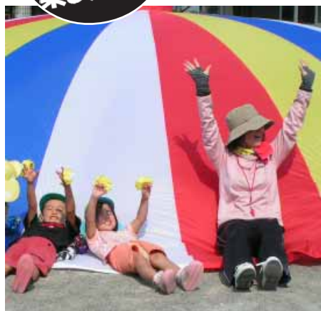
「みんなとお遊戯楽しいな」 (上南部保育所で)

町内の各保育所(園)と幼稚園が、来年度入所(園)希望児をそれぞれ次の通り募集します。お子さんの入所(園)を希望されるおうちの皆さんはそれぞれ申し込んでください。