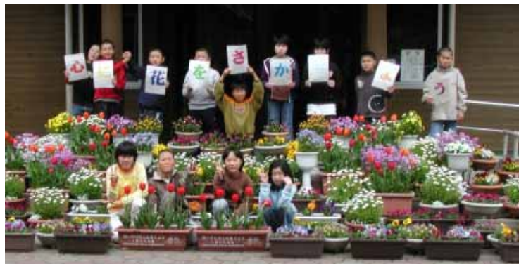
花々と清川小の6年生たち

清川小学校がこのほど、和歌山地方法務局と県人権擁護委員連合会が県内各小学校を対象に行った「第24回人権の花運動」で優秀賞を受賞しました(応募は106校、そのうち最優秀賞が5校、優秀賞が40校)。同校は毎年この運動に応募して優秀な成績を収めており、昨年は最優秀賞を受賞しています。