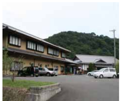
鶴の湯温泉(熊瀬川)