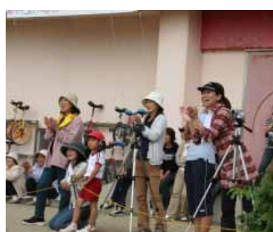
岩代小学校運動会で