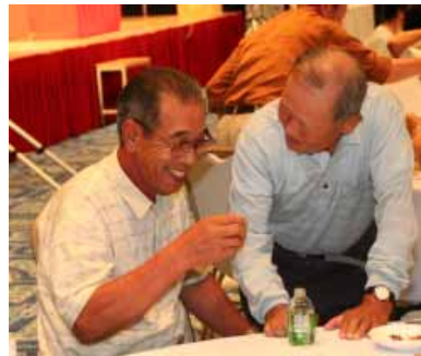
長寿の集い(敬老福祉大会)で