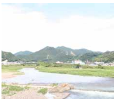
須賀橋から南部川上流を臨む