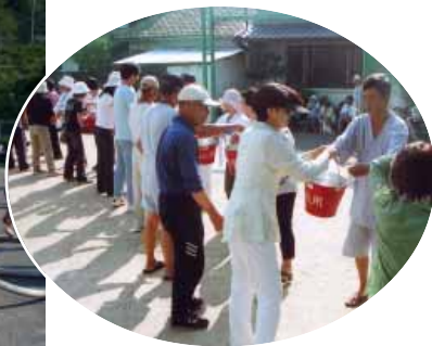
南道区のバケツリレー

町は9月3日(日)、第2回町内一斉防災訓練を実施しました。訓練には町内全34区から子どもからお年寄りまで5153人、全町民の約35%が参加しました。参加者は各区それぞれの避難場所への参集訓練などを行いました。