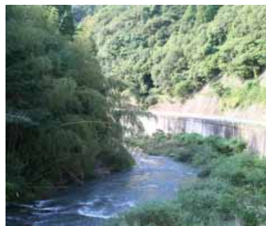
ホテルの観賞スポット(広野)