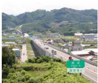
阪和自動車道みなべ IC 出口へ