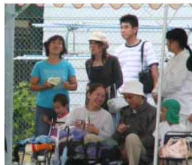
上南部小学校運動会で