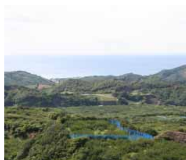
岩代大梅林から海を臨む