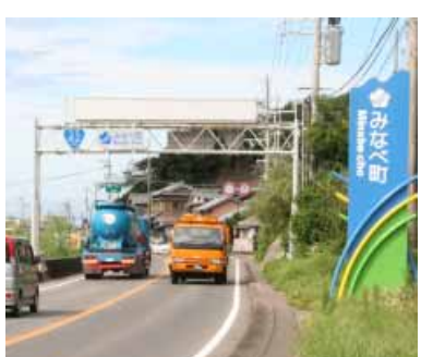
田辺市～みなべ町へ(国道42号線)