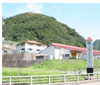
うめ21 研究センター(上)(東本庄)