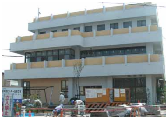
改修工事中の生涯学習センター。工事は10月中ごろ終了します

各室がきれいになったのはもちろん、エレベーターを新設したり段差を少なくしたりするなどバリアフリーにも重点をおいています。以前にも増して一層のご利用をお待ちしています。