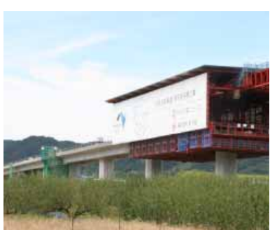
阪和自動車道南部高架橋工事中