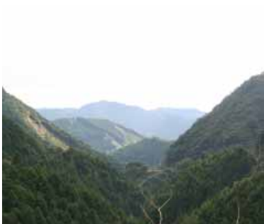
国道424号線から清川の山並みを臨む