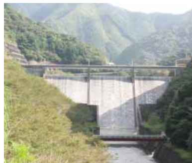
島之瀬ダム(東神野川)