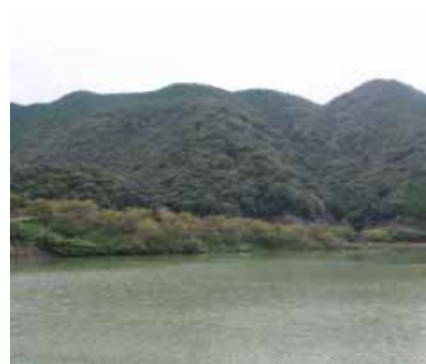
島之瀬ダムの湖(東神野川)