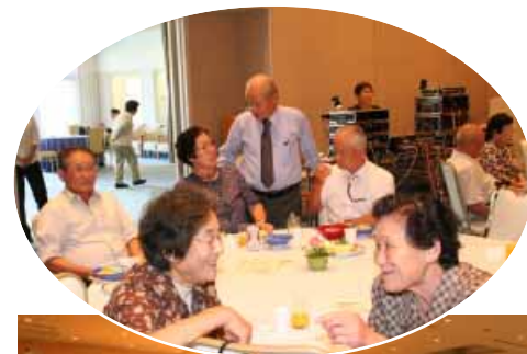
が久しぶりに会い、話

参加者らは「料理もおいしかったし、出し物もおもしろかった。良い1日でした」と喜んで帰られました。