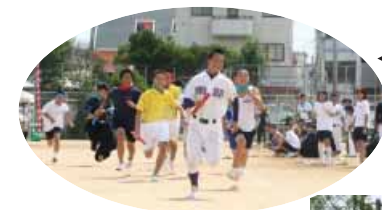
◀「記録より、記憶に残る体育祭！」クラブ対抗リレーでは、男子、女子とも陸上部が勝ちました(南部中学校体育祭)

3年生にとって最後の太鼓演奏。悪天候のため、体育館で行われました。(上南部中学校体育祭)▼