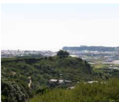
南部梅林からみなべ中心部を臨む