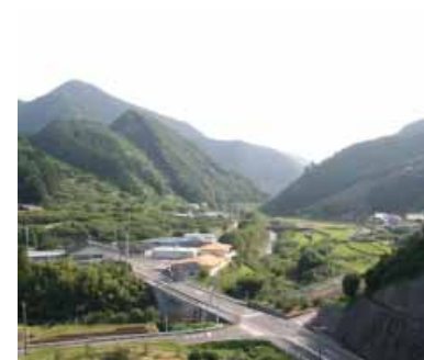
高城中学校から広野、滝地区を臨む