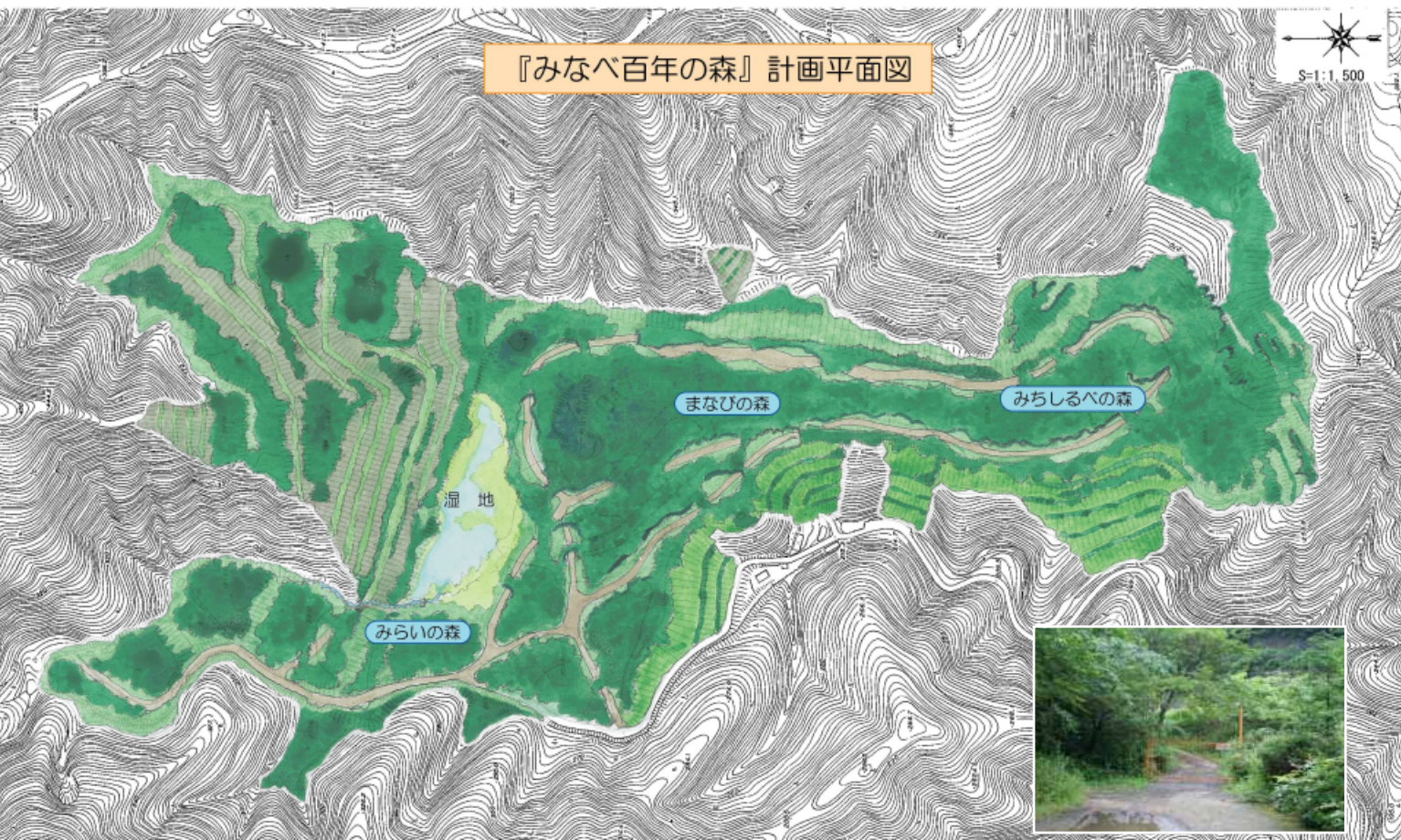
『みなべ百年の森』計画平面図