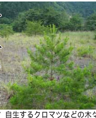
自生するクロマツなどの木々

百年の森づくりの場所・状態 みなべ百年の森づくりの土地は、東神野川地区内で、国道424号から約4キロのところにあります。現地では約22haの広大な平地が広がっています。開発が停止されてから約20年の間にも徐々に自然が再生され、クロマツ、ヤシヤブシ、クマノミスキ、クサギなどが自生しています。また、湿地帯もあり数種類のコケやヨシ、ガマも繁殖し、トンボなど水生昆虫も多く生息しています。 周辺の山は、スギ、ヒノキの人工林（町有林や区有林）となっています。