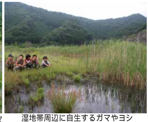
湿地帯周辺に自生するガマやヨシ

平成17年度の取り組み 平成17年9月10日、森が育む豊かな環境をテーマに、「みなべ百年の森・環境フォーラム」を開催。フォーラムでは、作家 立松和平氏が基調講演を行いました。その後、養父志乃夫・和歌山大学システム工学部環境システム