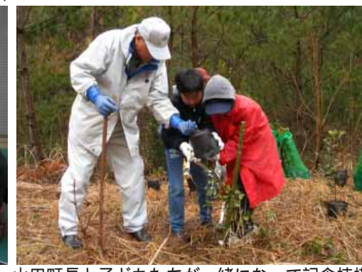
山田町長と子どもたちが一緒になって記念植樹

ム学科教授の司会で、パネルディスカッションが行われ、海・山・川それぞれで働く方たちが森への思いを述べました。 9月24日、第1回みなべ百年の森ワークショップを開催。26人の方が参加して三里峰の状態を見学した後、高城