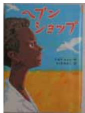
ヘブン ショップ デボラ・エリス (すずき出版)

ももちゃんぽっぽー(とよたかずひこ) おうちのともだち(柳原良平) あおい玉 あかい玉 しろい玉(太田大八) がちょうのベチューニア(ロジャー・デ・ボザン) ミロの絵本(結城昌子) 子どもがつくるのはらうた(工藤直子) クローカ博士の発明 ベスコフ童話集(エド・バズ) 天の鹿(安房直子) フラッシュ(カルル・イッ) 私は「蟻の兵隊」だった 中国に残された日本兵(奥村和一・酒井誠)