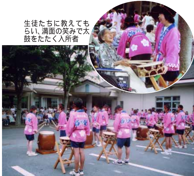
生徒たちに教えてもらい、満面の笑みで太鼓をたたく入所者

当日、生徒たちは「紀州梅林太鼓」「若梅フェスタ」など6曲を勢いよく演奏した後、入所者たちと話したり、ばちの持ち方や太鼓のたたき方などを教えたりと交流を深めていました。