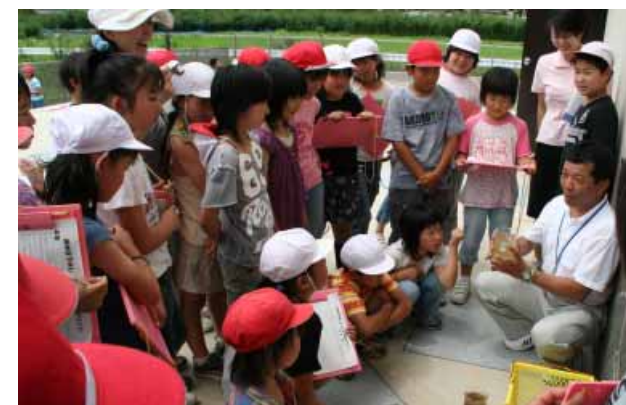
「この水がみんなの家などから流れてくる水だよ!」

7月3日(月)、上南部小学校4年生51人が社会科の授業の一環で、西本庄浄化センターを見学しました。