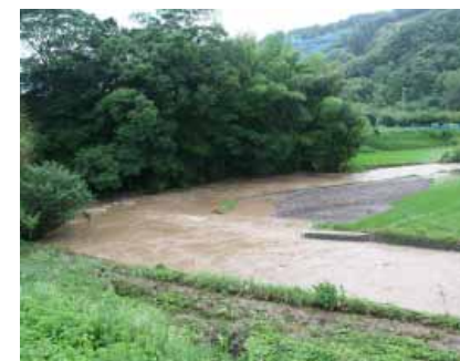
川の氾濫により土砂に埋もれた田んぼ

7月5日(水)、県南部は活発な梅雨前線の影響で、未明から雷を伴う激しい雨に見舞われました。