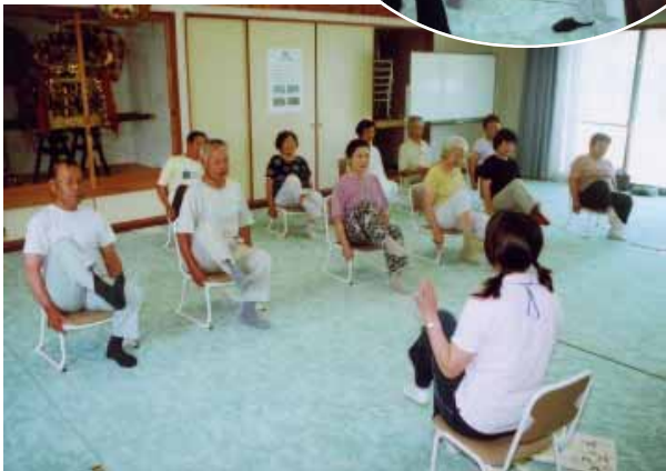
「1・2・3・4」と足のストレッチ体操

65歳ぐらいから上、中高年の皆さんにとって、「介護」という言葉は決して縁遠い言葉ではないと思います。では、このごろ「介護予防」という言葉を聞いたことはありませんか？