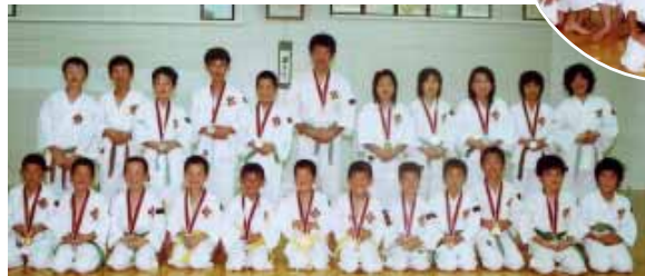
南部道院の選手 の皆さん

6月25日(日)、2006年少林寺拳法県民体育大会が和歌山市で開催され、南部道院の選手の皆さんが下記のように優秀な成績をおさめました。また、一般団体演武の部で優勝(最優秀賞)したチームは10月8日(日)、北海道で開かれる全国大会に出場します。