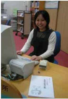
みんなの思いが詰まった 記念文集

ゆめよみ館では、この文集を希望する方に差し上げていますので、ご遠慮なくお申し出ください。