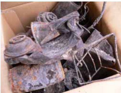
焼却場の灰に混じっていた金属類

半年間の月平均が368トンであつたものが、導入後の月平均は205トンにまでなつています。(平均の量は家庭ごみと事業系ごみの合計) 反対に、資源ごみのプラスチック類は毎月10～15トン、雑誌・ざつ紙は27～32トン収集されています。また、拠点回収