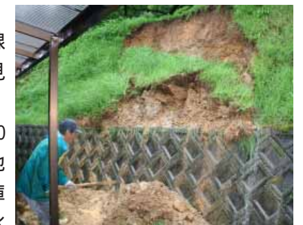
小規模の土砂崩れが数カ所で見られました

町でも、午前7時半から1時間で約100ミリの雨量を記録しました。高城・清川地区などでは、川が氾濫して民家1戸、倉庫1戸が床下浸水、また田んぼ・梅畑の冠水や土砂崩れ(町道4か所、住宅7か所)などの被害がありました。なお、災害箇所は農林課、建設課で調査中です。