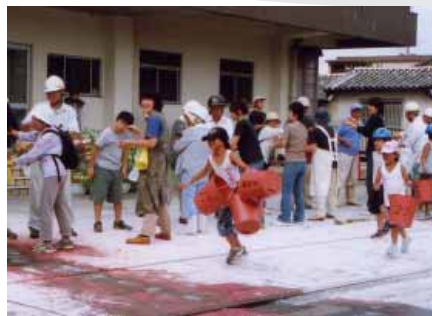
昨年の防災訓練(新町区で)

もし災害が起こったとき、どんなにがんばっても一人の力では到底乗り越えることはできません。災害時に大きな力となるのは何といたっても人と人との助け合いです。そのためには普段から家族で話し合い、また隣近所と声をかけあうなど地域の連携を深めておくことが大切です。