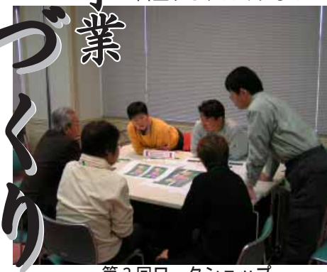
第2回ワークショップ

平成17年度の取り組み 平成17年9月10日、森が育む豊かな環境をテーマに、「みなべ百年の森・環境フォーラム」を開催。フォーラムでは、作家 立松和平氏が基調講演を行いました。その後、養父志乃夫・和歌山大学システム工学部環境システム