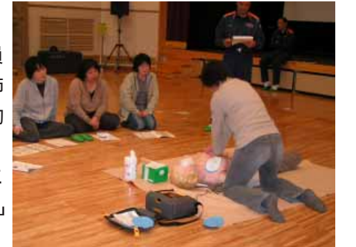
人形を使って、AEDの使用方法を学ぶ参加者

参加したクラブ員たちは、人形を使っての応急手当・処理を真剣にこなし、講師に「皆さん、救急車がいらないうらい、完ぺきにできました」とほめられていました。