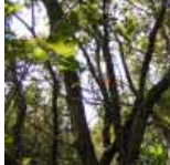
町の木 うげめがし