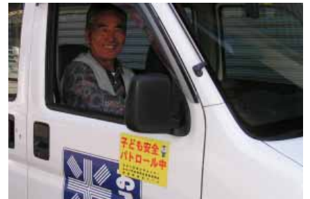
「子ども安全パトロール中」のステッカーが磁石式になりました

不審な人物がい ないか確認し、 不自然な様子 の子ども連れを見 かけたときは、 ためらわずに、 ひと声かけるよ うにしてください。