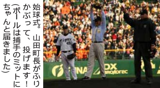
始球式。山田町長がふりかぶって、投げます！(ボールは捕手のミットにちゃんと届きました)

なお、2日、3日と、バックスクリーンに「紀州みなべ南高梅ナイター」の文字が大きく映し出されました。また、甲子園へのそれぞれ先着来場者3000人、合計6000人に梅干3粒入りパックと町のパンフレットをプレゼントしました。