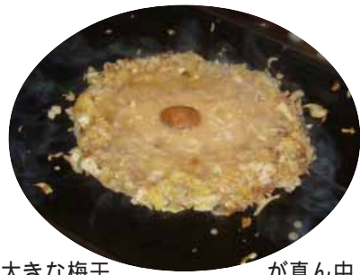
大きな梅干が真ん中でデンとにらみをきかしている紀州みなべの南高梅 梅もんじゃ

かっただというのです。実はこれは、昨年、町誕生1周年を記念して結成された全国6か所へPRに出かけた梅ロードキャラバン隊の一女性隊員の地道な努力の成果でした。昨年11月、東京へPRに出かけた折、この女性隊員らは夢やへ食へに行きました。おいしくいただきますながら、女性隊員は店長に「梅はもんじゃ焼きと合うと思う。使ってみてほしい」と頼みました