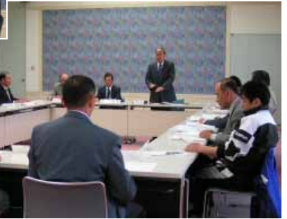
答申書を手にお礼を述べる山田町長