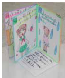
こんな絵本ができました