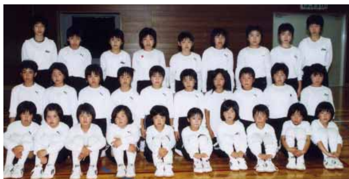
南部バレーボールスポーツ少年団の子どもたち