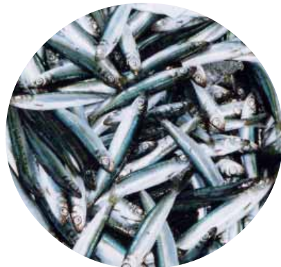
ピチピチとしたウルメイワシがどっさり

「今年の水揚げかい?今のところまあまあちゅうとこかなあ」。口を動かしながら、手は芸術的にすばやく、昨晚とってきたたくさんの魚をウルメイワシ、カタクチイワシ...と選り分けていきます。