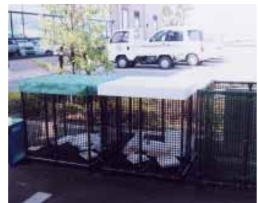
役場第1庁舎の公用車駐車場へ試験的に設置している食品トレイの回収ボックス

食品トレイは、役場など公共施設へ回収ボックスを置く予定です。ただ今、試験的に役場第1庁舎(芝)の公用車駐車場に回収ボックスを置いていきます。第1庁舎やその近くへ来られるついでにご利用ください。食品トレイの色や種類