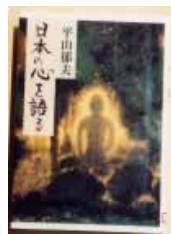
日本の心を語る 平山郁夫 (中央公論社)

日本画家として創作活動 の一方で、世界の文化遺産 の保存に取り組んでいる著 者から若い人々へのメッ セージ。伝統文化を理解し、 誇りを持って生きることの 大切さを心を込めて語る。