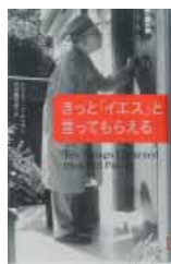
きつとイエスと言つてもらえる S・プレイデー(草思社)

上南部分館・子ども向け 怪物ガーゴンとぼく(L・アリ グサダ) 12歳からの被災 者哲学(メリアル・コンファルス・イン神 戸) カーニバルのおくりも の(R・シャーリップ ほか)