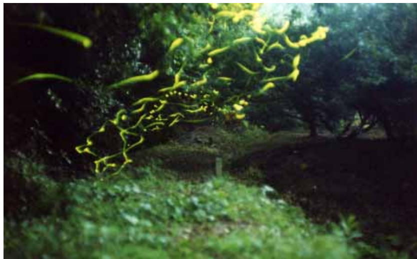
埴田・JR線路東側付近の梅畑 で舞うホタル