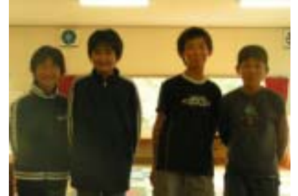
高城小学校児童会の皆さん