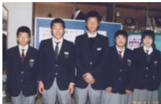
南部中学校生徒会の皆さん