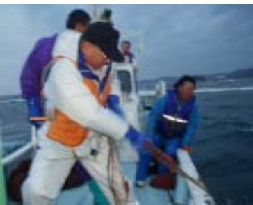
11月11日(木)早朝、山田町長は漁師さんの漁船に乗ってイセエビ漁に出港。「いい体験をさせてもらってます。みなべの魚もどんどんPRしていきます」

山田町長 もちろん、その通りです。新みなべ町は、農・林・水産、商工業と均整のとれた産業を持った町です。全体の地産産業をさらに振興させることにより、地域外からより外貨を導入することができます。それによつて町全体の経済が潤うことになり、最も大事なことです。梅と炭はすでにプラ