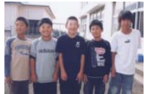
岩代小学校児童会の皆さん