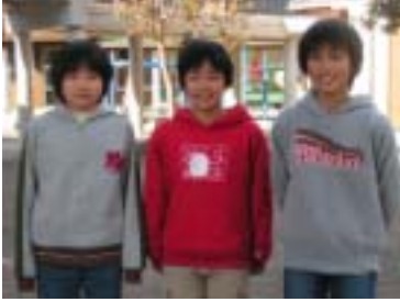
清川小学校児童会の皆さん