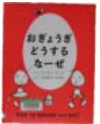
おぎょうぎ どうする なーぜ マンロー・リーフ(偕成社)

海へのあさ(川口トモキヨシ) アイウエ王とカキケケ公(三芳悌吉) やねのうかれねずみたち(マ・シャル) シップ船長といえるかのイトちゃん(かどのえいこ) ソフィとカタツムリ(ディック・キグ・スズ) わんわん探偵団おりこう(杉山亮) 祈祷師の娘(中脇初枝) 星空から来た犬(グイア・ウイン・ジョンズ) ふしぎなカプセル 鳥のたまご(池内俊雄) 暴力の世界地図(藤田千枝) ほか