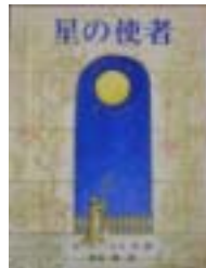
星の使者 ビター・シス(徳間書店)

はじめまして数学1-3(吉田武) つる姫(阿久根治子) 忘れ川をこえた子どもたち(M・グリーペ)