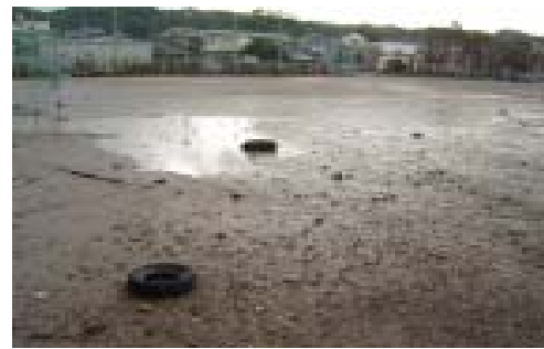
10月21日(木)、台風23号によって海水が流れ込み荒れてしまった南部中学校グラウンド

山田町長 こちらは早くしなければならぬと思っています。なぜ、台風の時海水が運動場に流れ込んだのかわかりました。海からの越波とともに、排水口からの逆流が大きかったため、排水口