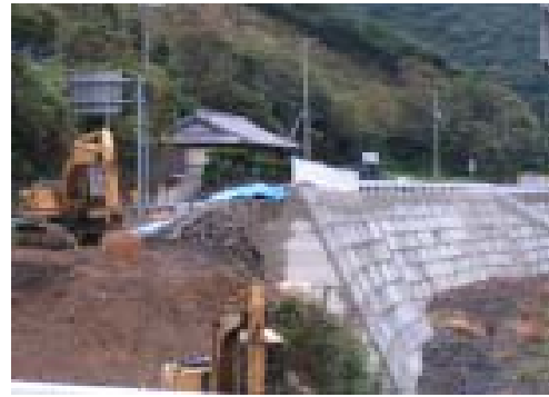
「完成したら道幅も広くなって通行しやすくなります」。高城地内で進んでいる国道424号線の改良工事

今、高城地内で改良工事を進めていますから、できるだけ早く清川まで届くようにします。