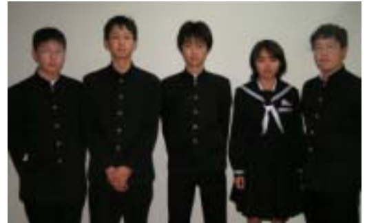
高城中学校生徒会の皆さん