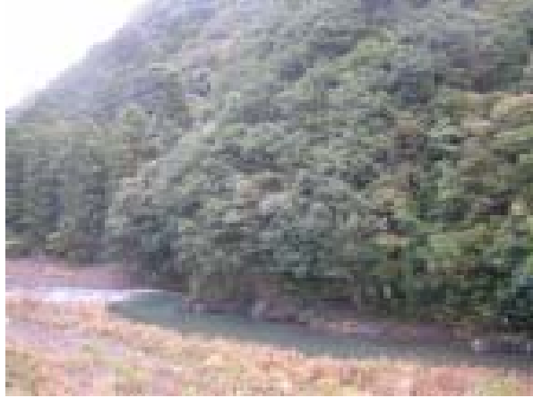
山を守り、川を守り、海を守り、みなべ町の自然を未来へずっと残していきたい

専門委員会では、漢字の「南部町」か、ひらがなの「みなべ町」か、採決の結果、ひらがなの「みなべ町」に決定され、それが合併協議会で承認されました。