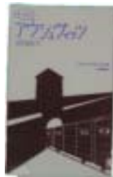
娘と話すアウシュヴィッツについて? アネット・ヴィヴィオルカ (現代企画室)

フランスの歴史学者が、娘の質問に答えながら、やさしい言葉でアウシュヴィッツについて説明します。腕の青インクの数字の入墨の意味は? ゲットって何? 大切なのは人類が行った事実を知っておくこと・・・。