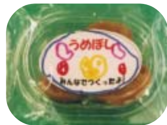
園児たちが作った梅干しが、参加者へのおみやげに配られました