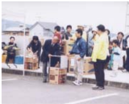
山田町長も抽選にチャレンジ。誰に当たるかなあ

会場にはリサイクル品や古着、花、手作り品のほか飲食店など30店舗が出展。出店者の中には友達同志