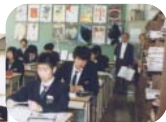
生徒たちの熱心な発表に、訪れた保護者らも真剣に聞き入っていました