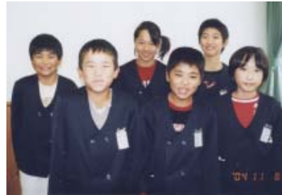
上南部小学校児童会の皆さん