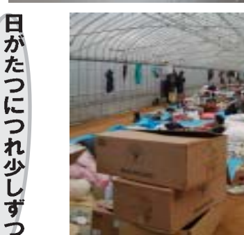
地震で陥没した道路(上)と、地震発生直後すぐ作物を撤去し、地域内の人たちが寝泊まりできるようにしたビニールハウス(下)(共に小千谷市内で)

びました。中には被災した方たちに少しでも元氣を出してもらおうとみなべ町の子どもたちが一生懸命描いた絵やおもちもありました。