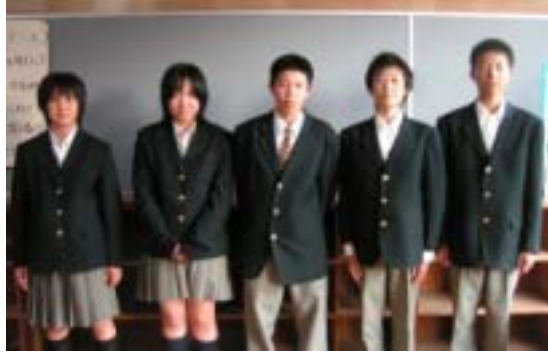
上南部中学校生徒会の皆さん