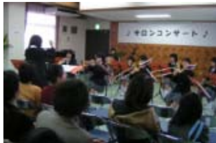
息がびつたりだった南部中吹奏楽部の演奏