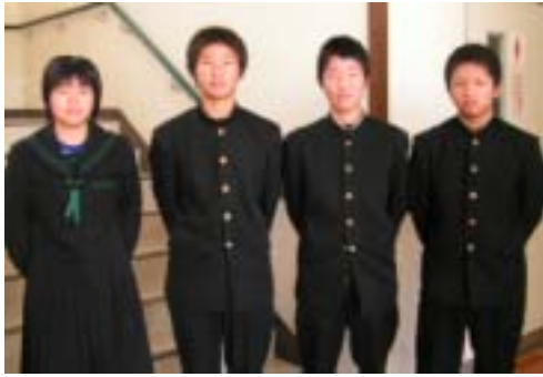
清川中学校生徒会の皆さん