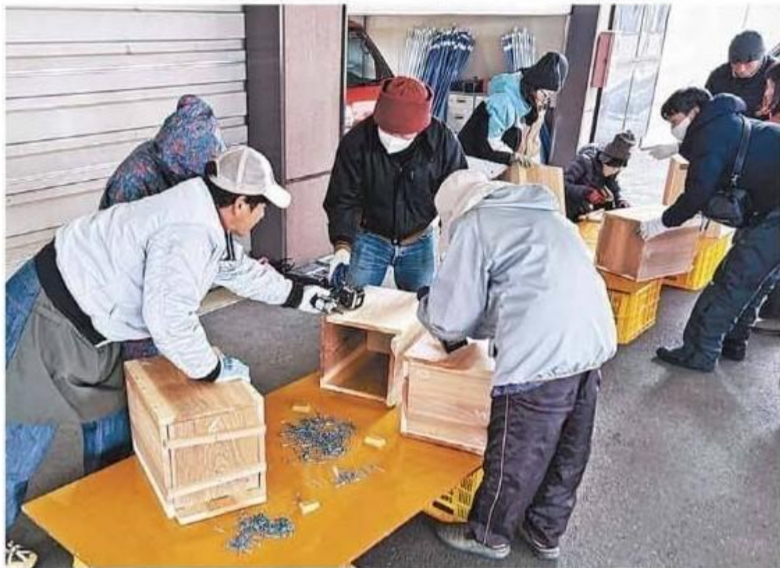
ミツバチの巣箱を作る参加者 (みなべ町芝で)