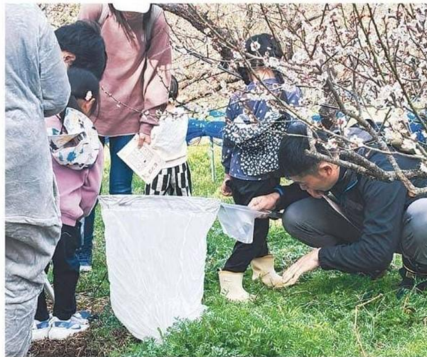
有機栽培の梅畑で、昆虫などを採集する子どもたち (みなべ町晩稲で)