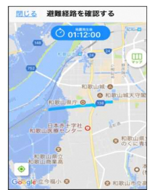
【トレーニング結果表示】