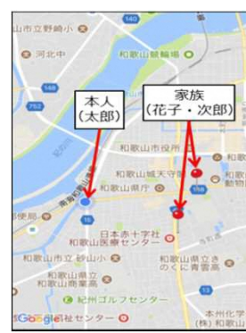
【家族の居場所確認】