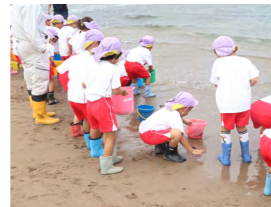
森の鼻の浜辺へクエの稚魚を放流

10月5日、みなべ愛之園こども園の年長児40名がクエの稚魚放流体験を行いました。 この日は、8月下旬に県南部栽培漁業センター(串本町)から無償配布され、紀州日高漁協の漁師らが約10センチほどに育てたクエの稚魚に子どもたちが最後のエサやりをしました。 その後、子どもたちは、バケツに入った稚魚を、森の鼻の浜辺へ放流しました。クエさん、元気に大きくなってね。