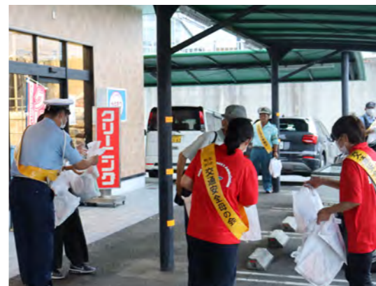
Aコープみなべ店にて街頭啓発

9月21日から30日までの10日間、秋の全国交通安全運動が実施されました。 運動の初日には、交通事故をなくするみなべ町民運動推進協議会の皆さんが買い物に來られた方に街頭啓発を行いました。 啓発では、夕暮れ時と夜間の交通事故防止や自転車等のヘルメット着用などを呼びかけました。 皆さんも交通ルールを守り安全運転を心がけましょう。