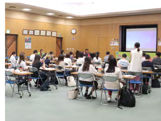
梅について質問をする学生

学生たちはこのほか、町内の農園を訪れ、梅の塩漬けや天日干しの作業を見学し、たくさん質問を投げかけていました。