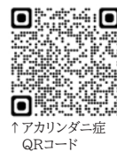
↑アカリンダニ症 QRコード