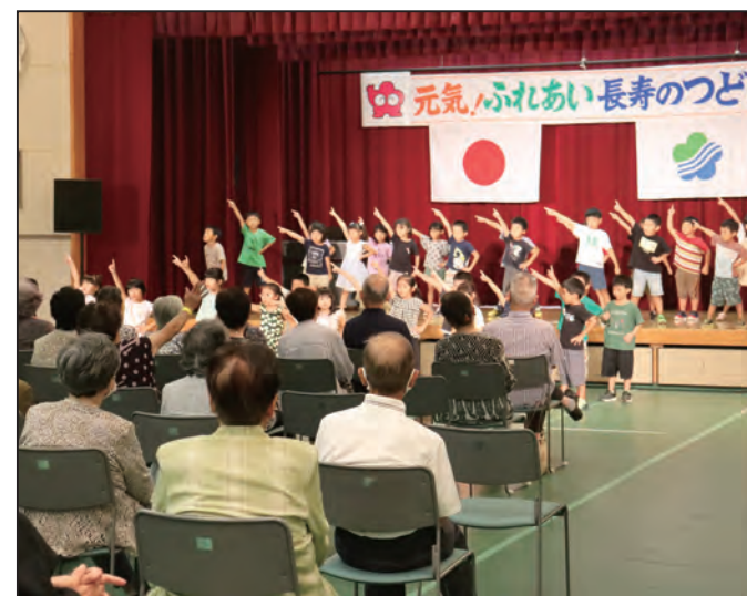
▲みなべ愛之園こども園の園児による歌とダンス

☎ 0738-22-0695（音声案内「2」）9:00～17:00(土日祝日を除く)