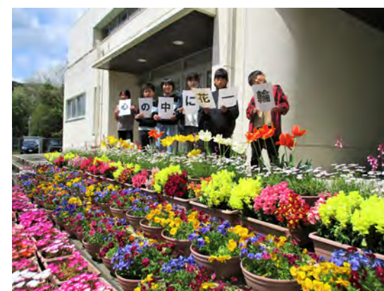
高城小学校栽培委員のみなさん

これは、花づくりを通じて美しい環境整備とコミュニティの活性化を図り、花と緑と笑顔がふれる和歌山を創造することを目的に和歌山県花を愛する県民の集いが実施しているものです。