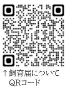
↑飼育届について QRコード