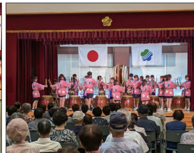
▲上南部中学校の生徒による和太鼓演奏