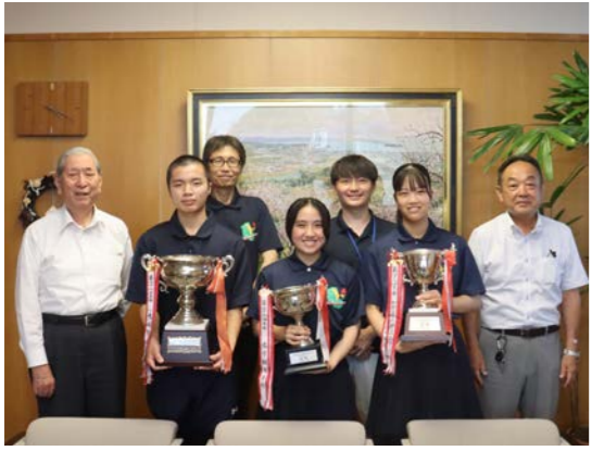
神島高校少林寺部のみなさん