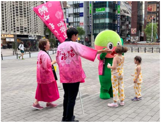
新橋駅 SL 広場で梅干し配布

また、みなべ町のマスコットキャラクターのプララやのぼり旗でみなべ町のPRを行いました。