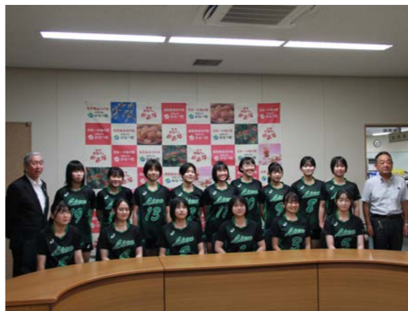
リアンのみなさん