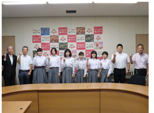
南部中学校剣道部のみなさん