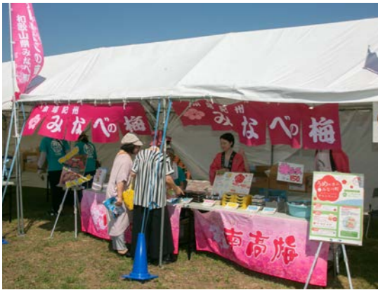
自治体 PR ブース

イベントでは自治体PRブースを設置し、梅干しなど梅加工品の販売、梅や観光のPRを行いました。