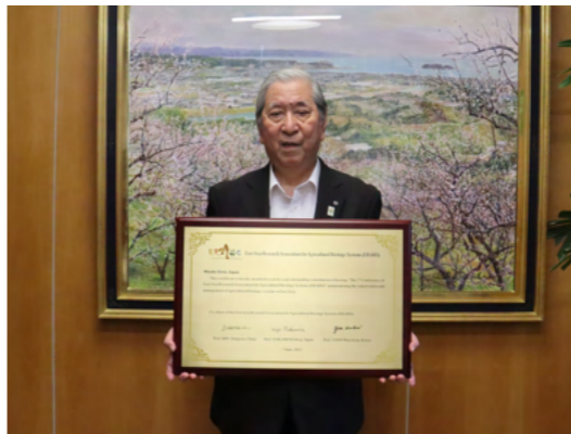
東アジア農業遺産学会より贈呈された感謝状

この感謝状は、平成30年にみなべ・田辺地域で開催された「第5回東アジア農業遺産学会(ERAHIS)」の主催と東アジア農業遺産システムの保存と管理の促進における貢献に対するものです。