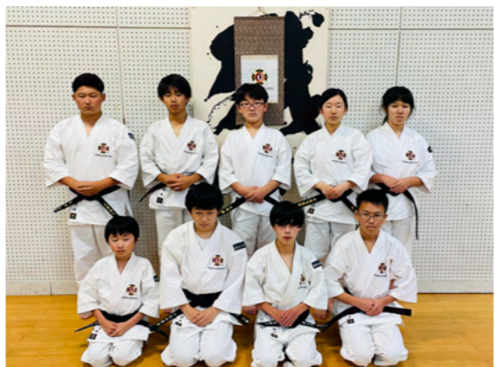
南部スポーツ少年団の皆さん