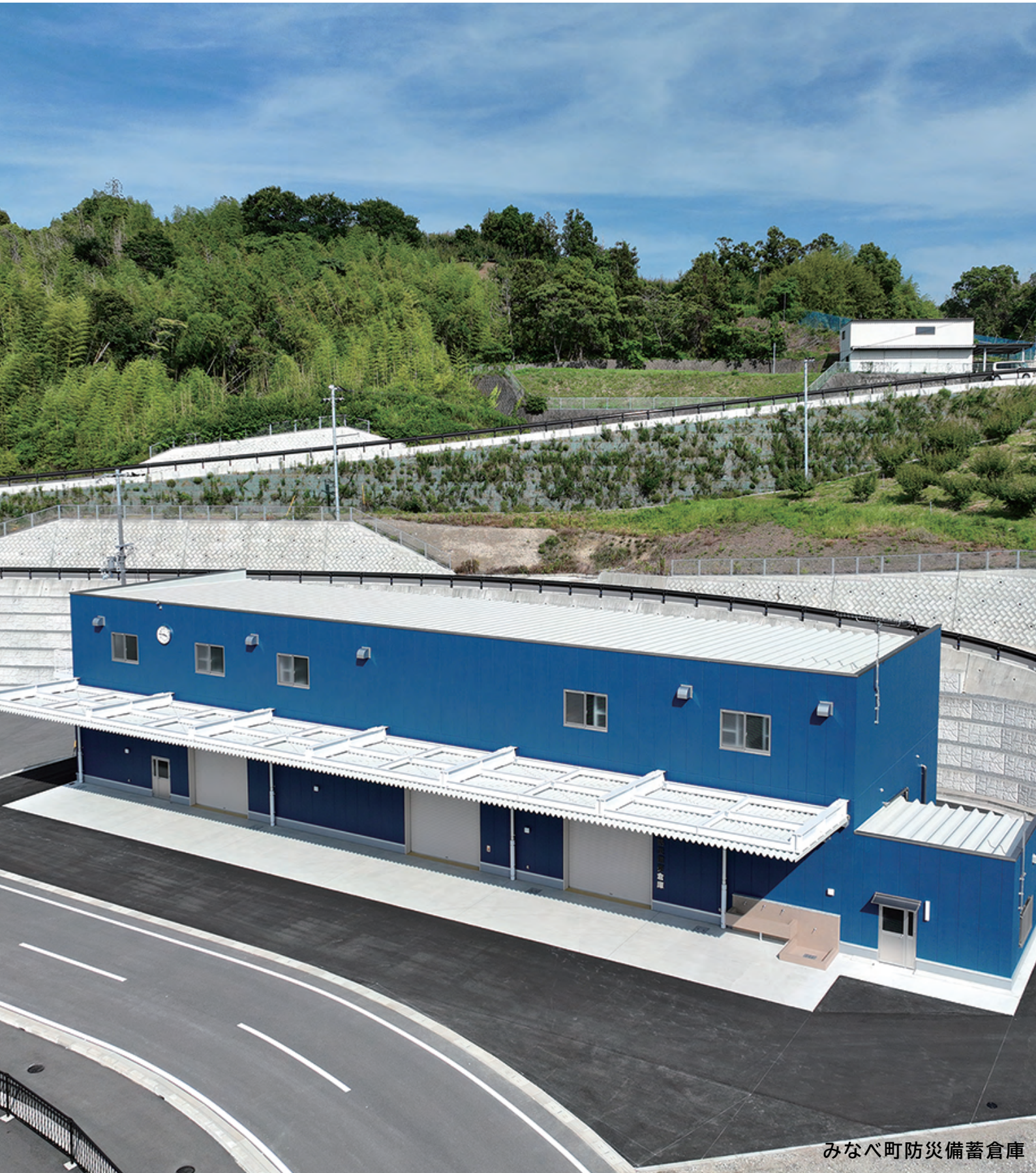
みなべ町防災備蓄倉庫