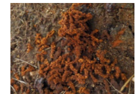
株元に溜まったフラス