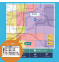
土砂災害危険度情報