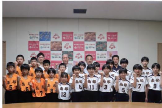
南部バレーボールスポーツ少年団の皆さん

優勝した南部バレーボールスポーツ少年団は、8月7～10日に東京体育館等で開催される全国大会に出場されます。 全国大会での活躍を期待しています！