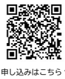
申し込みはこちら↑

くわしくは、NPO法人キャリアファシリテーター協会(☎073-425-3720)へ。