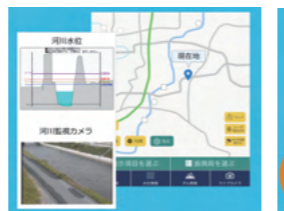
河川水位・河川カメラ