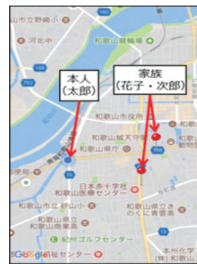
【家族の居場所確認】