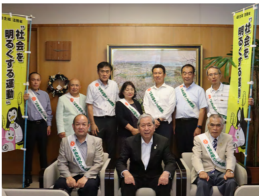
保護司会の皆さん

この運動は、すべての国民が犯罪や非行の防止と、犯罪や非行をした人たちの更生について理解を深め、安全で安心な明るい地域社会を築くための全国的な運動です。