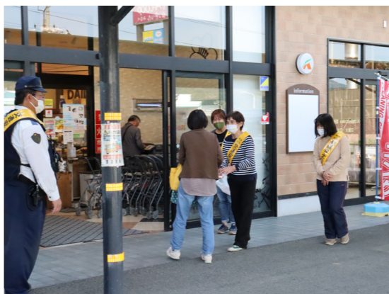
Aコープみなべ店にて街頭啓発

5月11日から20日までの10日間、春の全国交通安全運動が実施されました。運動の初日には、交通事故をなくするみなべ町民運動推進協議会の皆さんが買い物にいられた方に啓発チラシ等を配布しました。併せて、4月から努力義務化された自転車乗車時のヘルメット着用や、横断歩道を渡る際の「サイン+サンクス運動」について啓発を行いました。