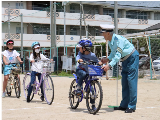
自転車の交通ルール乗を学ぶ小学生

4月から、町内の各小中学校では、通学中などの交通事故防止のため交通安全教室が開かれました。5月10日、南部小学校（全校生徒234名）では、警察官や交通指導員の指導のもと、横断歩道の渡り方や自転車の安全な乗り方などについて学びました。みんなで交通ルールを守ることが、命を守ることに繋がります。子どもたちの通学時には、地域の皆さんで見守りをお願いします。