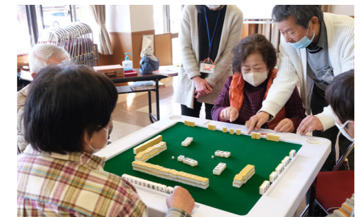
昨年度の健康マーじゃんの様子