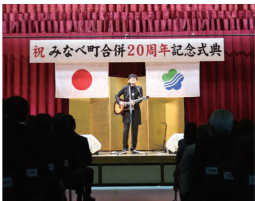
手拍子が起こるなど会場全体が盛り上がりました。