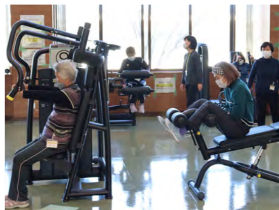
トレーニング教室の様子

4月からは、自主活動として毎週金曜日にはあと館(南部郵便局前)で実施されています。運動指導の先生やお友達と一緒に楽しく運動を始めませんか。