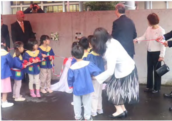
園児らによる除幕式

開園式では、町長からの式辞があり「保育所がこども園に変わり、父母の就労に限らず入園できるようになった。保護者の方々の協力を得ながら、子どもたちの拠点となるよう頑張りたい」と述べました。