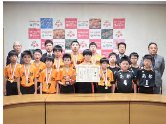
南部バレーボールスポーツ少年団の皆さん

町長からは「次からは追われる立場になるが、連覇を目指してほしい。健康に気を付けて、これからも頑張ってください。」との言葉が贈られました。