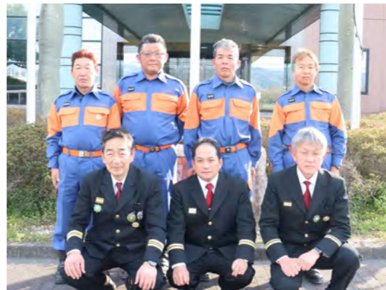
表彰された消防団の方々