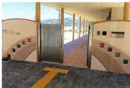
みなべ愛之園こども園