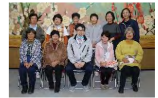
⑤あさまりんどうサロン