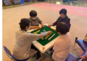
㉓ニコニコサークル