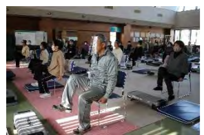
⑳はあと寝込まんず