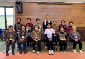
㉒いきいき脳トレサークル