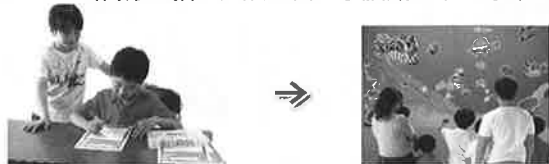
『紙アプリ』は㈱リコーの商標でイベント向けソリューションです